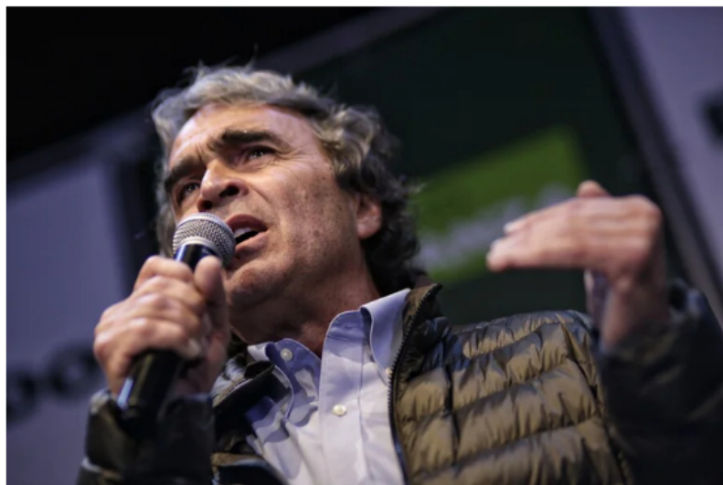
El excandidato presidencial insiste en realizar un Acuerdo Nacional contra la corrupción.

La política colombiana ha tenido varias polémicas en los últimos días y uno de los grandes señalados es el gobierno saliente del presidente Iván Duque. Los cuestionamientos por parte de diferentes frentes políticos no se han hecho esperar y uno de ellos ha sido Sergio Fajardo , excandidato presidencial, quien criticó lo sucedido recientemente con respecto a las “regalías para la paz”,