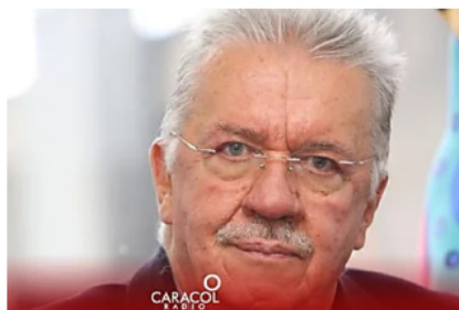
El alza del dólar es un fenómeno global