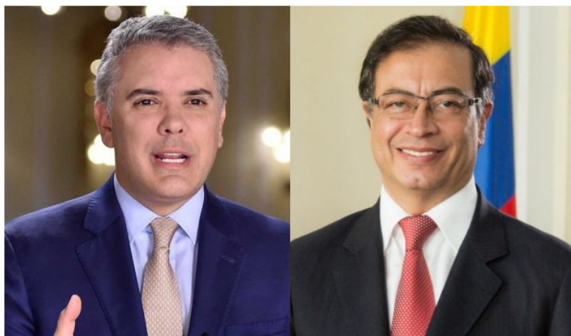
Iván Duque y Gustavo Petro.

El actual presidente de Colombia, Iván Duque Márquez, se refirió este miércoles a los recientes anuncios que hizo el mandatario electo, Gustavo Petro, sobre la Junta Directiva de Ecopetrol y lo posibles cambios que habría. Lea más de petróleo.