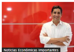
Noticias Económicas Importantes Con inversión de $30.000