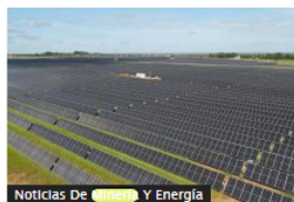
Noticias De Energía Y Energía Colombia completó 25 granjas