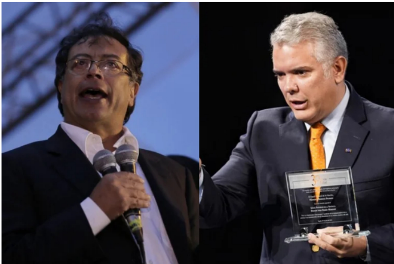
Gustavo Petro e Iván Duque

Uno de los principales planes del presidente electo Gustavo Petro es hacer esfuerzos para acelerar la transición energética en el país con el objetivo de disminuir las fuentes de carbón y petróleo . Será clave el papel de Ecopetrol y por tanto quienes compongan la junta directiva, una puja que ya empezó con lo que podría dejar el actual gobierno y el margen de maniobra para el entrante.