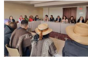
¿Tensión en el Pacto Histórico? Las tres ausencias de peso durante el retiro programático