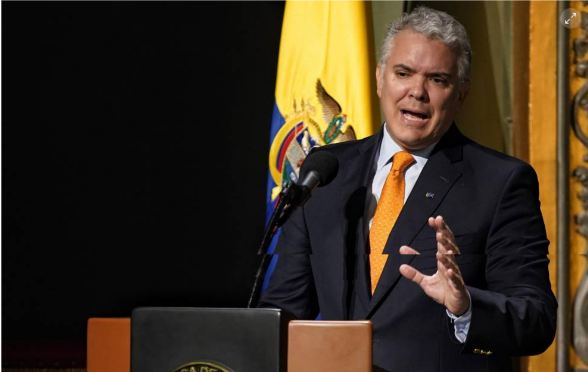
Iván Duque, presidente de Colombia.