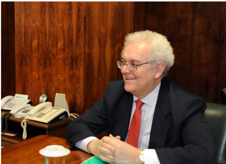
José Antonio Ocampo

Por: Redacción BLU Radio | 13 de Julio, 2022