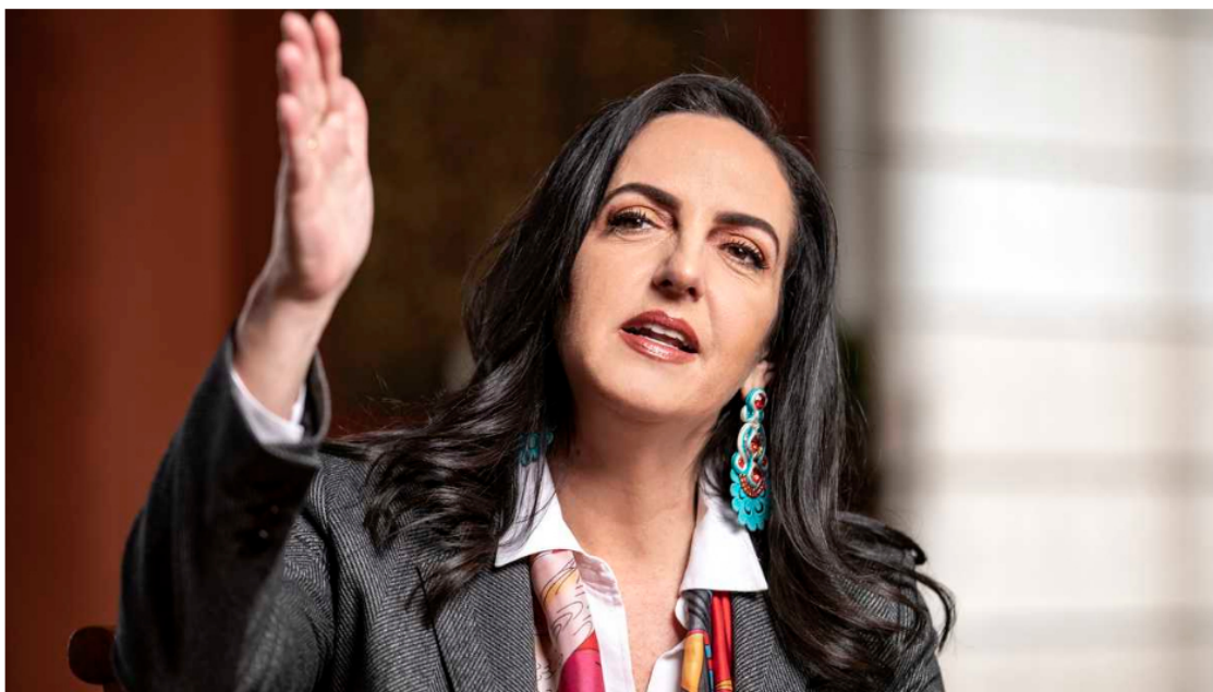
María Fernanda Cabal hará oposición a Petro.