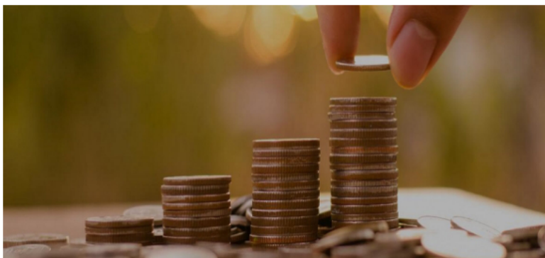
A todos nos conviene que el ministro Ocampo logre ejecutar con éxito la consolidación fiscal que necesita Colombia y que de ella resulte un país menos desigual.

Este subsidio tiene el problema de que la mayoría de los recursos no llega a las personas de menores ingresos, sino a quienes consumen más gasolina, por ejemplo, los narcotraficantes que la usan para producir cocaína. Pero eliminar este subsidio implica aumentos en el precio de la gasolina y el transporte, con el rechazo consiguiente del común de las personas.