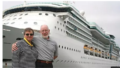
Cruceros de lujo por el Mediterráneo 2022: los precios pueden sorprenderte

Tendencias | Enlaces Patrocinados | Patrocinado