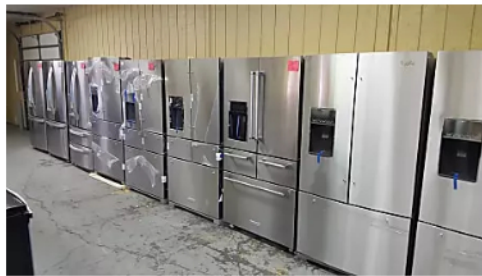
Los refrigeradores que no se han vendido están a precio de ganga

Refrigeradores | Anuncios de Búsqueda | Patrocinado