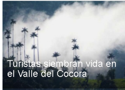
Turistas siembran vida en el Valle del Cocora