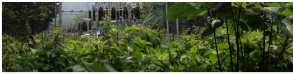
Estos proyectos tienen una inversión estimada por Aneel superior a los US$700 millones y comprenden 1.139 kilómetros de líneas de transmisión.

“Brasil es un mercado relevante en la región y en constante crecimiento, que representa oportunidades de negocio interesantes para ISA en el sector de transmisión de energía. Siempre buscamos nuestra participación en aquellas donde consideramos podemos ser competitivos y generar adecuados niveles de rentabilidad para nuestros accionistas, pero que también aporten al progreso y desarrollo de sus ciudadanos”, dijo Juan Emilio Posada, presidente de ISA.