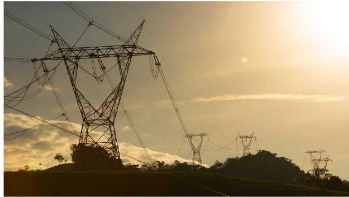
En los últimos años, Cteep ha ganado en Brasil 16 proyectos en subastas de transmisión.

ISA, a través de su filial ISA Cteep, ganó dos proyectos a través de una subasta pública realizada por la Agência Nacional de Energia Elétrica (Aneel) en São Paulo, que le permiten a la compañía seguir consolidando su participación en el mercado eléctrico brasileño, el mayor de Latinoamérica.