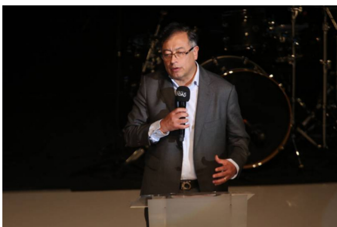
Gustavo Petro durante la presentación del informe final de la Comisión de la Verdad en Bogotá (Juan Pablo Pino)

El funcionario ya anunciado para el gobierno del Pacto Histórico se refirió a este tema crucial en la economía colombiana