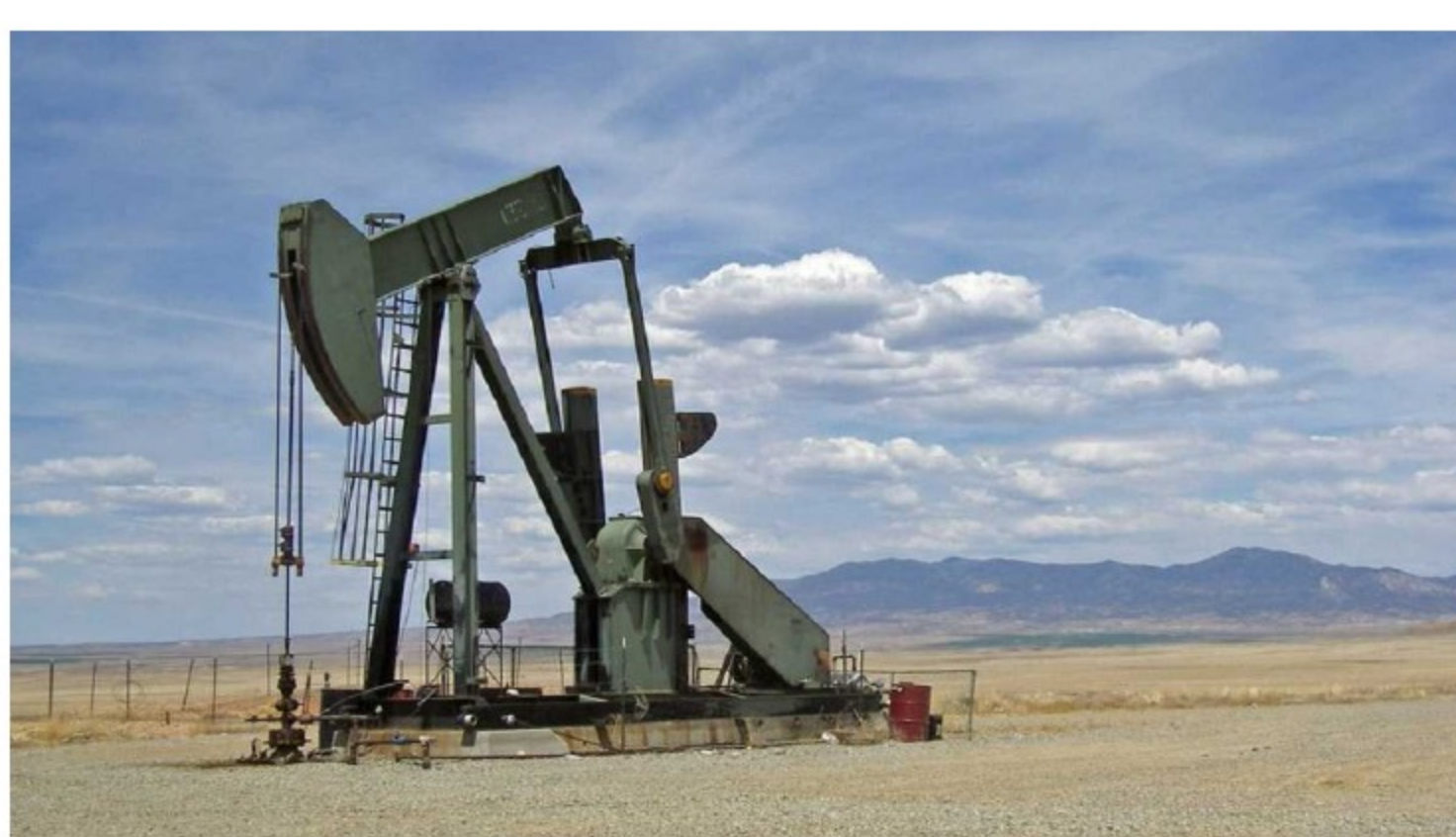
Rusia responde por 11,5% de la producción mundial de crudo.

*Para que en 2021 se alcancen las cifras de 2013, el precio de Brent debería ser de 186 dólares por barril (hoy bordea los 100) y aunque claro un precio más alto genera beneficios fiscales, el problema está el déficit del Fondo de Estabilización de Precios de los combustibles, que es con el que se subsidia el precio interno de la gasolina. Ese déficit terminará este año en 11 billones de pesos, una cifra superior a los dividendos*, explican los expertos del banco, al tiempo que señalan que Rusia y Ucrania también son grandes proveedores de gas, lo que afectará los precios internacionales, pero en Colombia eso no se sentirá, pues la producción se consume internamente y no hay capacidad exportadora, lo cual hace que el mercado local esté desligado de la dinámica externa.