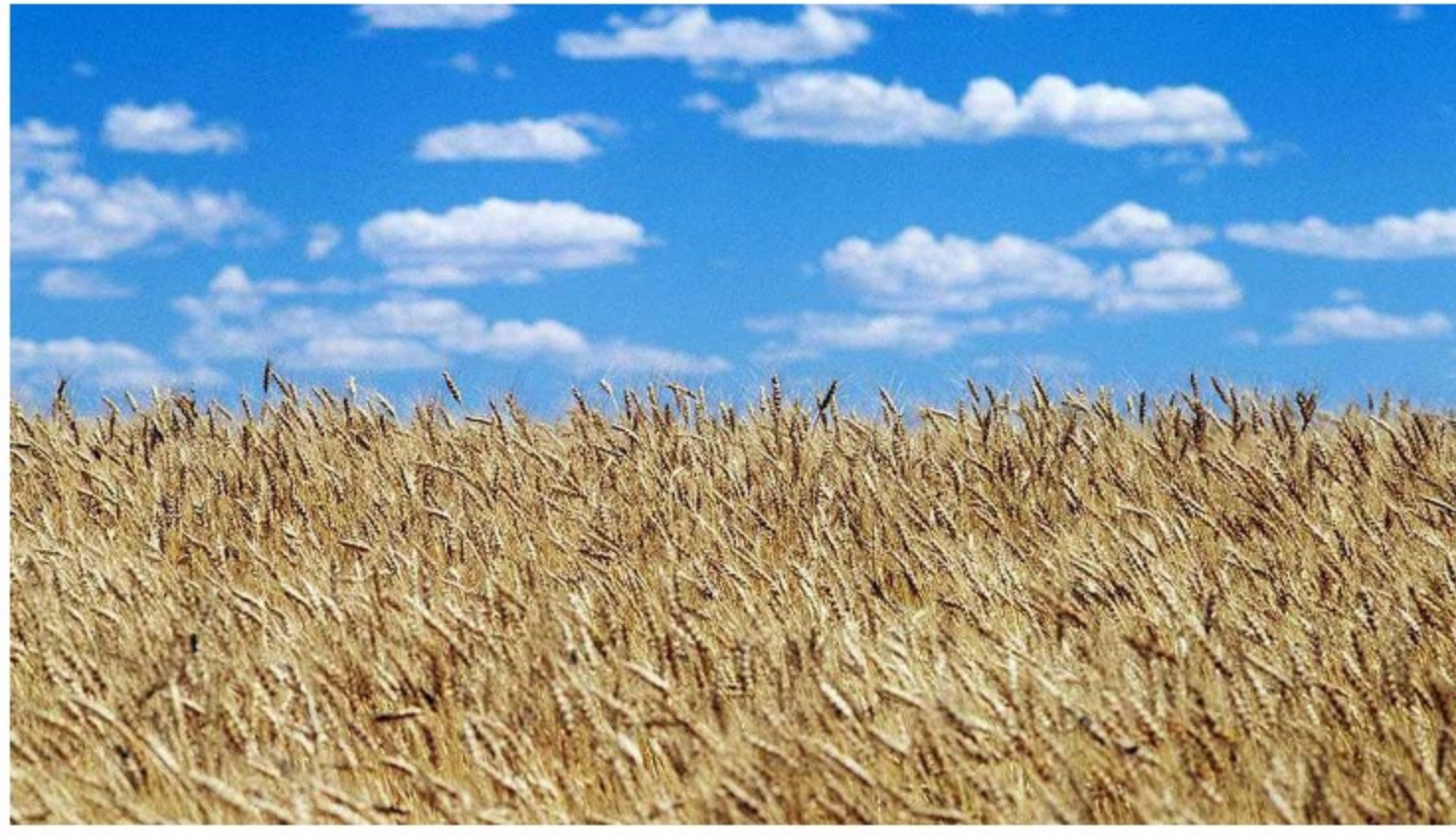
Cultivos de trigo

En el frente de la cebada y del maíz amarillo, que no se importan de Rusia y además se tiene producción nacional, el problema estaría en la formación de precios locales, los cuales a su vez dependen de los internacionales. Rusia y Ucrania responden por 24% de las exportaciones globales de cebada y 13% de las de maíz amarillo, así como 60% de las de aceite de girasol. En este caso Colombia tiene la ventaja de ser un gran productor de aceite de palma, con lo cual se puede reemplazar el de girasol.