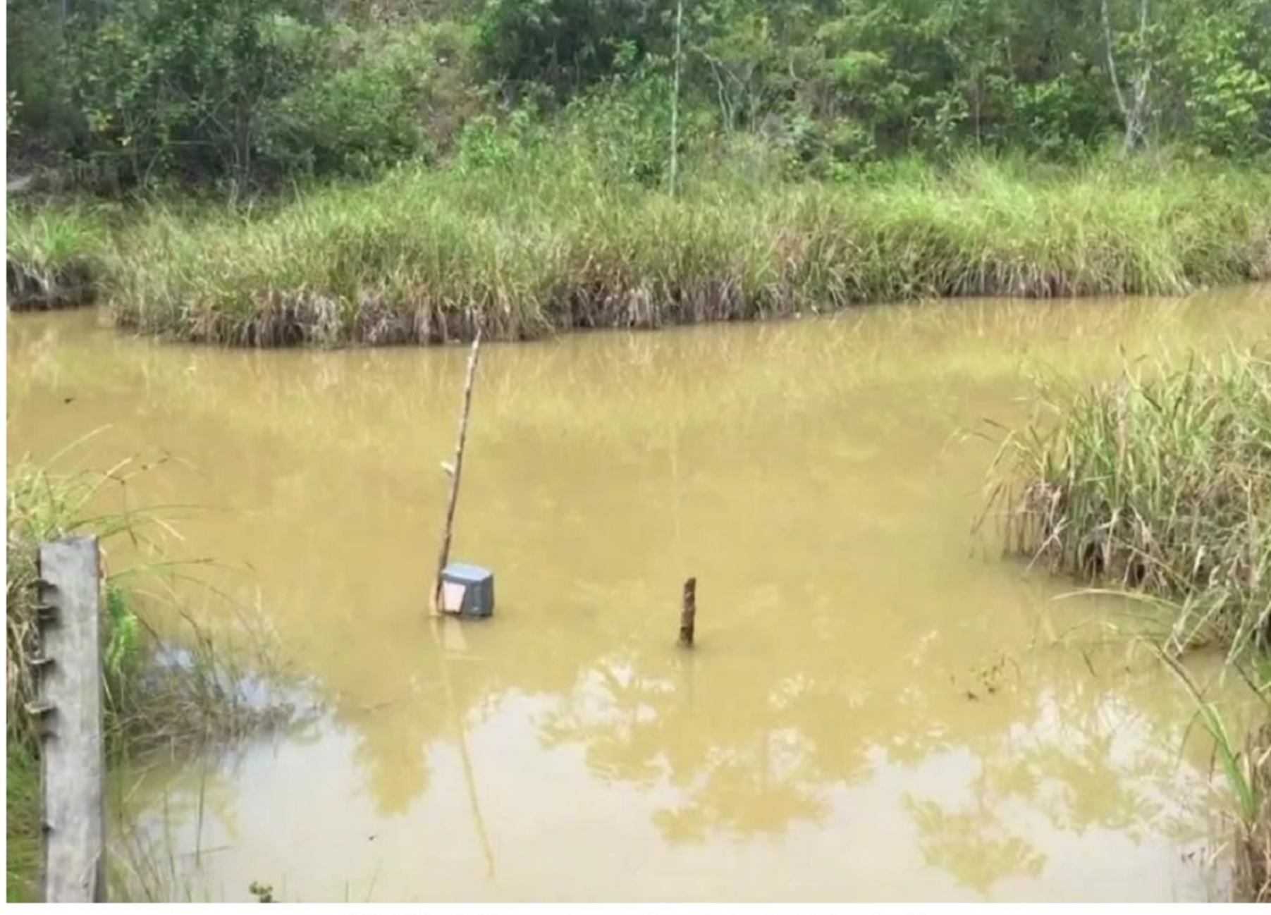
BLU Radio. Acuíferos en Barrancabermeja

A pesar de las posibles irregularidades en los mapas entregados por la CAS, la comisión del POT del Concejo de Barrancabermeja avanza en su aprobación.