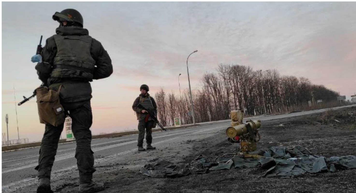
Los miembros del servicio de las fuerzas armadas ucranianas se encuentran junto a un sistema de misiles montado en un trípode en las afueras de Kharkiv, Ucrania, el 24 de febrero de 2022.

Economías en desarrollo, como la colombiana, se pueden ver desfavorecidas, "por lo cual puede haber un efecto cruzado entre el menor apetito de riesgo y el mayor precio del petróleo por lo menos momentáneamente", manifestó Sergio Olarte.