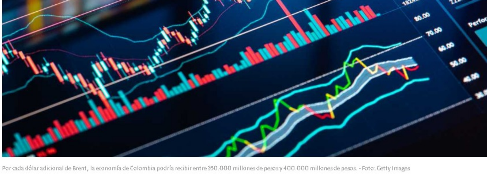
Por cada dólar adicional de Brent, la economía de Colombia podría recibir entre 350.000 millones de pesos y 400.000 millones de pesos.

Muchos creerían que, como Rusia y Ucrania están ubicados en otro continente, a una distancia de más de 12.000 kilómetros de Colombia, el país está libre de cualquier efecto de este conflicto, pero no es así. La invasión que realizó este jueves Rusia en Ucrania puede dejarle a la economía colombiana consecuencias positivas y negativas.