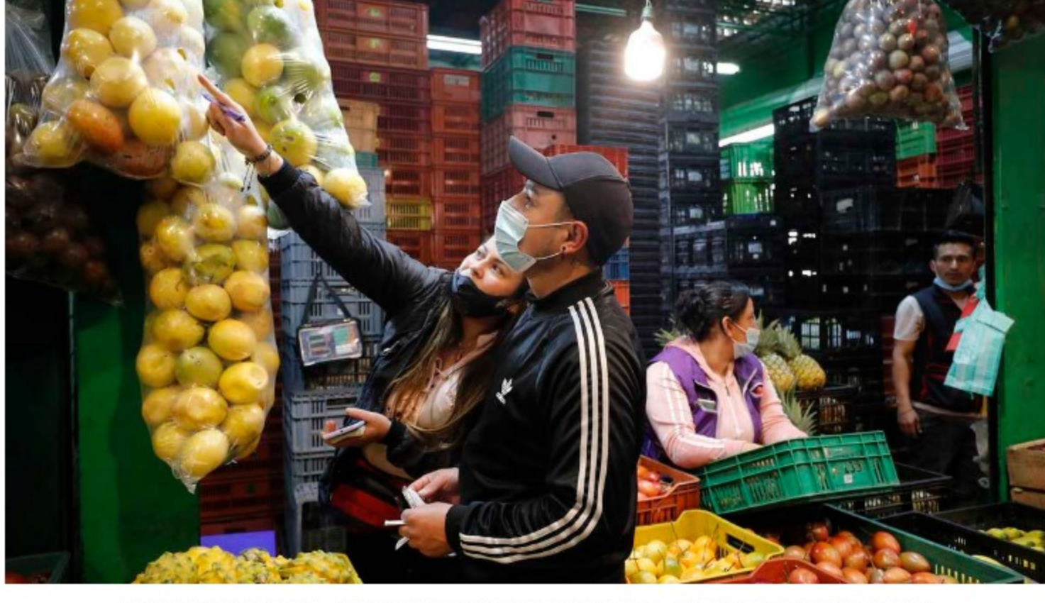
La invasión de Rusia a Ucrania puede ocasionar una presión al alza de la inflación.

Sin embargo, un precio Brent alto ayuda a las finanzas de Ecopetrol , que para 2022 se trazó un presupuesto de inversión entre 4.800 millones de dólares y 5.800 millones de dólares, el cual fue construido con una expectativa de precio Brent de 63 dólares por barril, en promedio. Para dar utilidades positivas, la compañía necesita que el barril esté en 35 o 36 dólares.