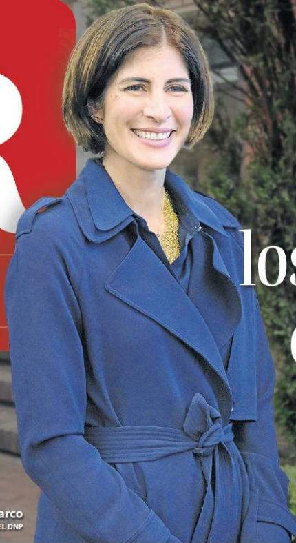
Alejandra Botero Barco DIRECTORA DEL DNP

HACIENDA. "ESTAMOS EN LA FASE DE DISEÑAR VISIÓN COLOMBIA 2050"