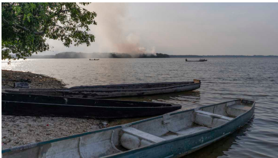
10/03/2021. Estación de monitoreo ambiental en el kilómetro 8 de Puerto Wilches para el piloto de Fracking dispuesta por Ecopetrol . Foto: Natalia Ortiz Mantilla - Foto: Puerto Wilches Fracking piloto

Hay que recordar que el proyecto piloto de fraccionamiento hidráulico, mejor conocido como fracking, está ubicado en cercanías del casco urbano de Puerto Wilches, en Santander. El área de exploración, para llegar a establecer definitivamente los impactos ambientales de esa técnica para obtener combustibles está cercano a la ciénaga Yarirí, y, por supuesto, al río Magdalena.