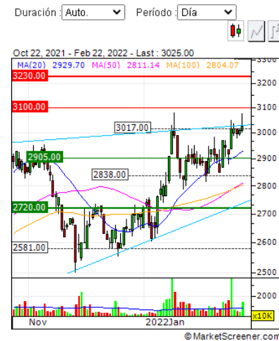
Gráfico ECOPETROL SA