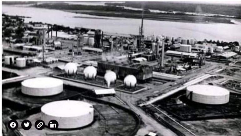
Refinería de Barrancabermeja en los años 40.

Le recomendamos: El reto de los 'transmilenios' para que en Colombia no se bajen del bus