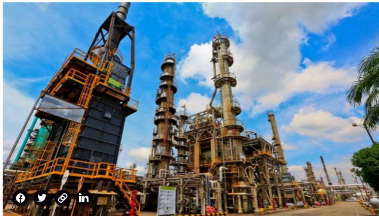
Refinería de Barrancabermeja en la actualidad.

Le recomendamos: La increíble y triste historia del libro robado de Gabriel García Márquez