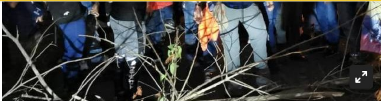
Bloqueo Puerto Wilches