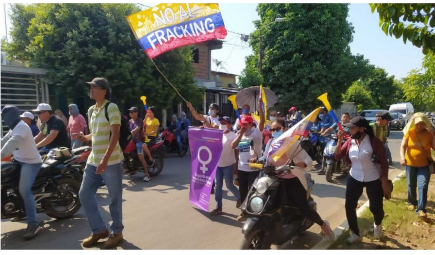
Debido a las protestas, la audiencia pública se está transmitiendo por diferentes canales virtuales.

Ecopetrol ratificó que el proceso de fracturación hidráulica para extraer petróleo incorpora al menos 16 Tecnologías de Mínimo Impacto (TMI), orientadas a la minimización de impactos ambientales y a la reducción de riesgos.