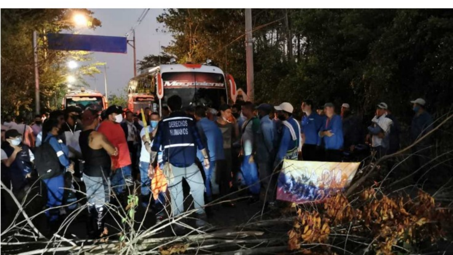
El Esmad de la Policía hace presencia en varios sectores de Puerto Wilches por las protestas.

Por su parte, la Corporación Podion denunció que la audiencia pública ambiental es ilegítima, porque la Anla está haciendo un proceso de licenciamiento ambiental exprés. "Sabemos que la decisión de darle la licencia ambiental al piloto de Fracking Kalé a Ecopetrol , ya está tomada", aseguró.