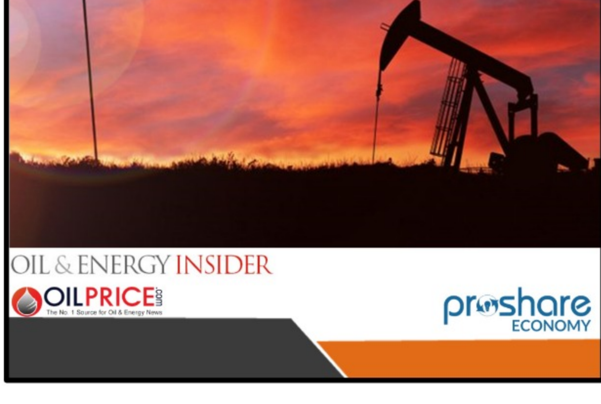
sábado, 19 de febrero de 2022 / 06:00 a.m. / por Tom Kool de Oilprice.com