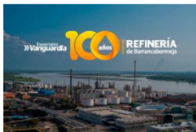
Refinería de Barrancabermeja: un siglo de progreso

Al respecto, Ecopetrol detalló en que esta inversión en el centro de refinación se hará entre 2022 y 2024 y estará destinada a la incorporación de tecnología, la modernización y confiabilidad de sus plantas y la gestión ambiental.