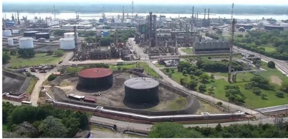
Refinería de Barranca

• Esta refinería es un activo estratégico de la Nación. Atiende el 80% de la demanda de combustibles del interior del país y abastece de productos petroquímicos a la industria nacional.