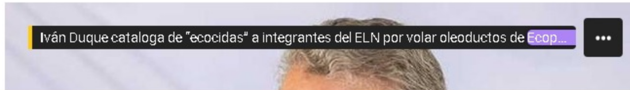
Iván Duque cataloga de "ecocidas" a integrantes del ELN por volar oleoductos de Ecopetrol

Iván Duque también lanzó puyas a quienes desmeritan el uso del petróleo en el país.