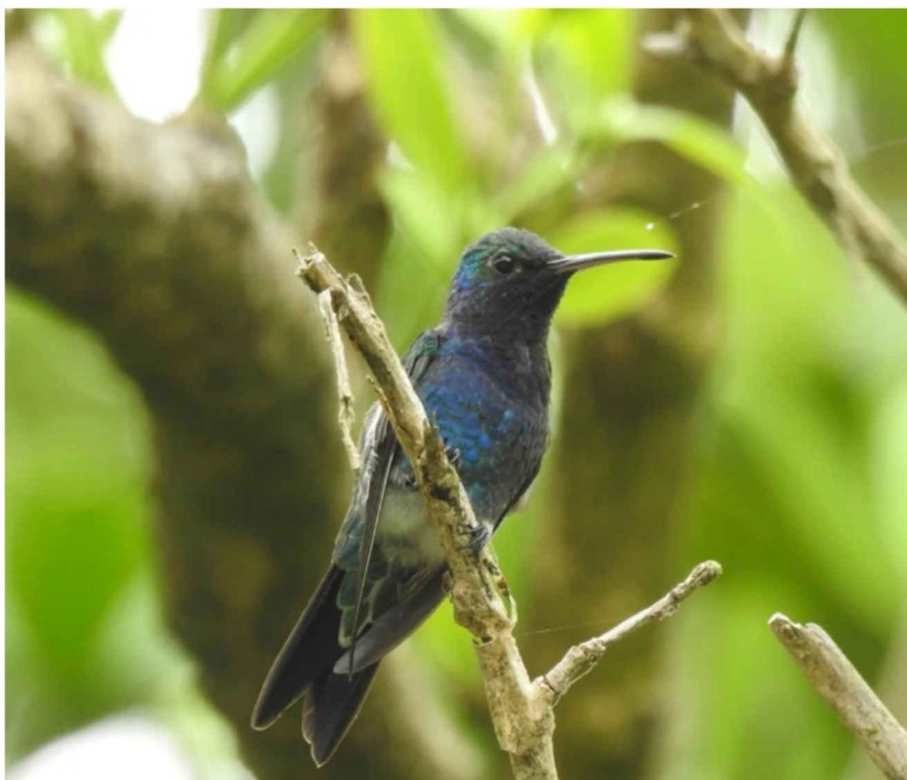
En la imagen, una de las 241 especies de aves registradas en la Isla Salamanca.

Este viernes 18 de febrero el Instituto de Investigación de Recursos Biológicos Alexander von Humboldt y Ecopetrol designaron nueve áreas adicionales de conservación en el territorio nacional, con el propósito de contribuir a la protección de la biodiversidad en el país y la ampliación de la oferta de servicios ecosistémicos.