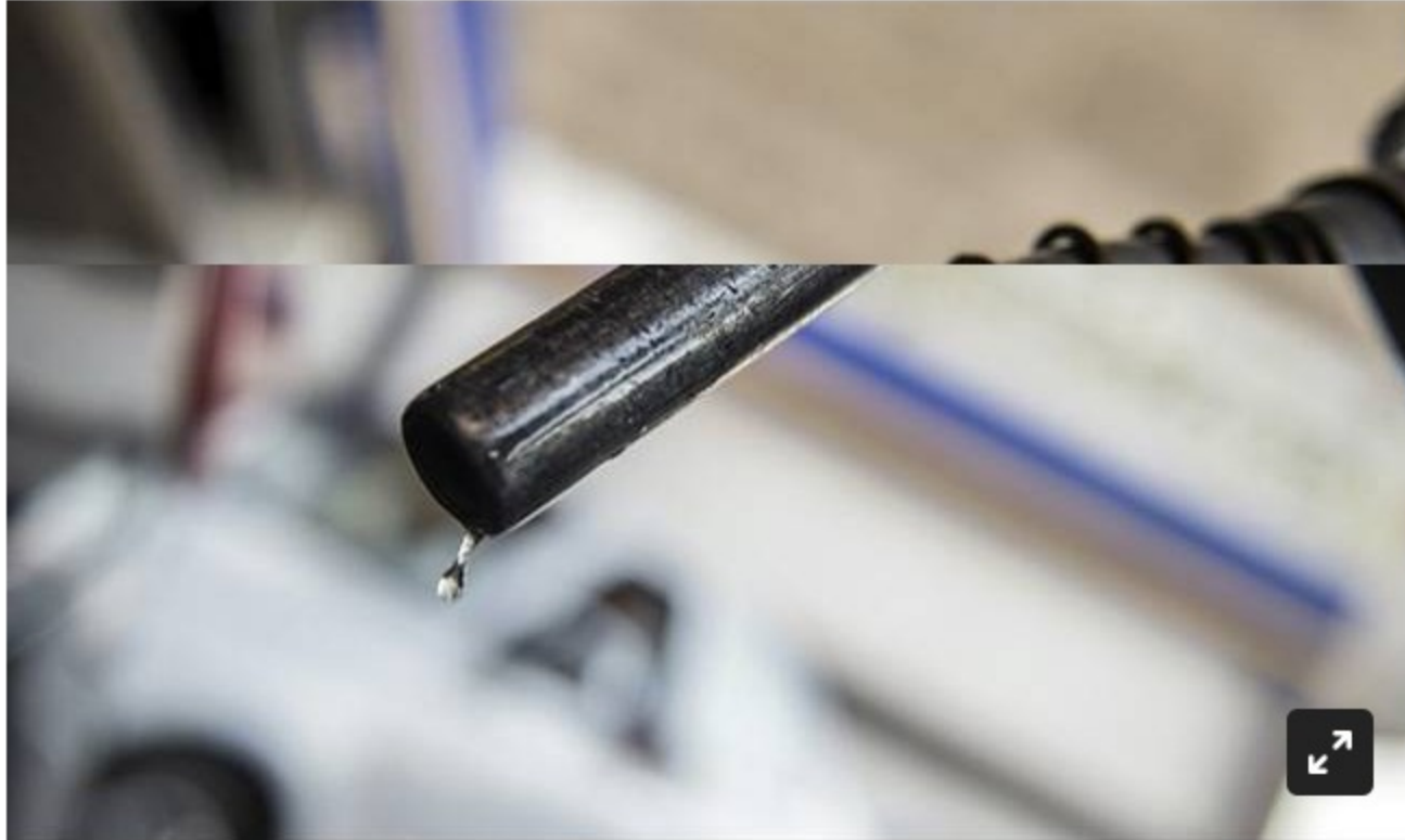
La forma en que el MinMinas ha atendido el abastecimiento de combustibles en el Amazonas.

En los próximos días se espera que llegue a Leticia un nuevo cargamento de combustibles importados desde Brasil.