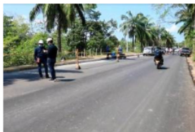
Vía a El Centro, en Barrancabermeja, se salva de una 'colombianada'

Entre los avances más significativos que ha tenido la planta son los de pasar de, en sus inicios hacer uso de madera como combustible para refinar cerca de 1.500 barriles de petróleo cada día, a contar con un tecnológico sistema que amplió este rango a 225.000 barriles diarios.