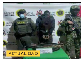
23 capturados tras operativos policiales esta semana