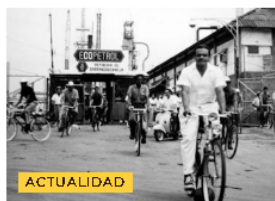
100 Años de historia de la refinería de Barrancabermeja