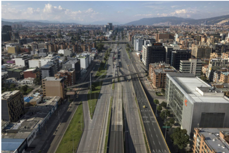
Bogotá, Colombia Los vehículos circulan por carreteras casi desiertas en esta fotografía aérea tomada en Bogotá, Colombia, el domingo 22 de marzo de 2020.