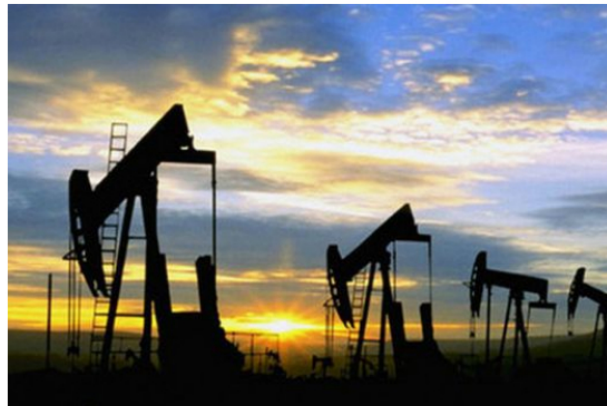
El precio del crudo en los mercados internacionales se encuentran en un pico alto por la crisis de Ucrania.