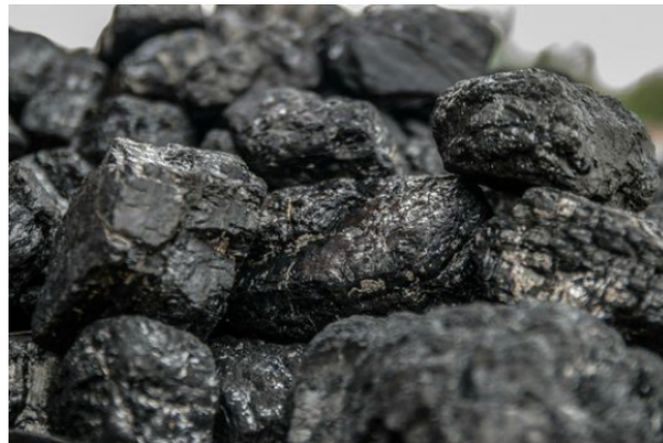
El carbón sigue levantando recursos para programas de financiación pese a las promesas de cero emisión.