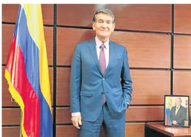
Vicepresidencia de la República

El Ministerio del Trabajo anunció que desde el pico de la pandemia se recuperaron 1,19 millones de empleos formales, según estimaciones de Ángel Custodio Cabrera, ministro de esta cartera. El funcionario anotó que los incentivos de los empleadores para mantener y hacer crecer sus nóminas han sido el factor que más ha contribuido a la reactivación del mercado laboral en el país. (NGG)