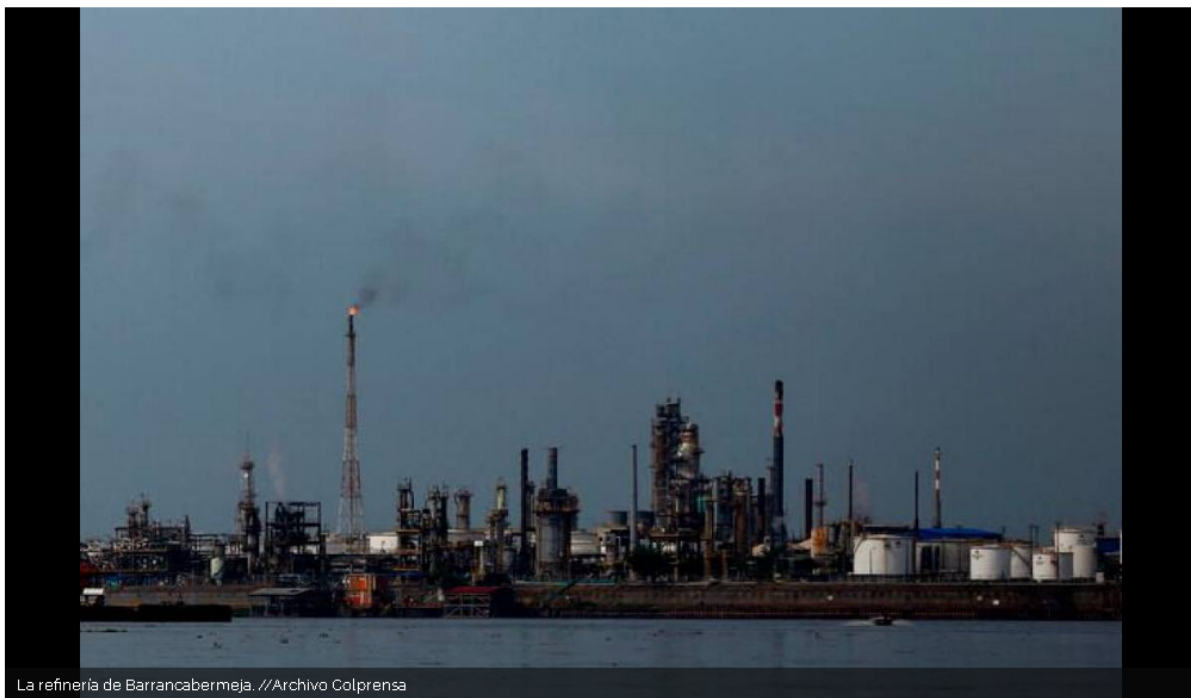
La refinera de Barrancabermeja.

De acuerdo con información preliminar, un artefacto explosivo impactó la línea 703 de agua y crudo que llega a la estación 7 del campo La Cira Infantas.