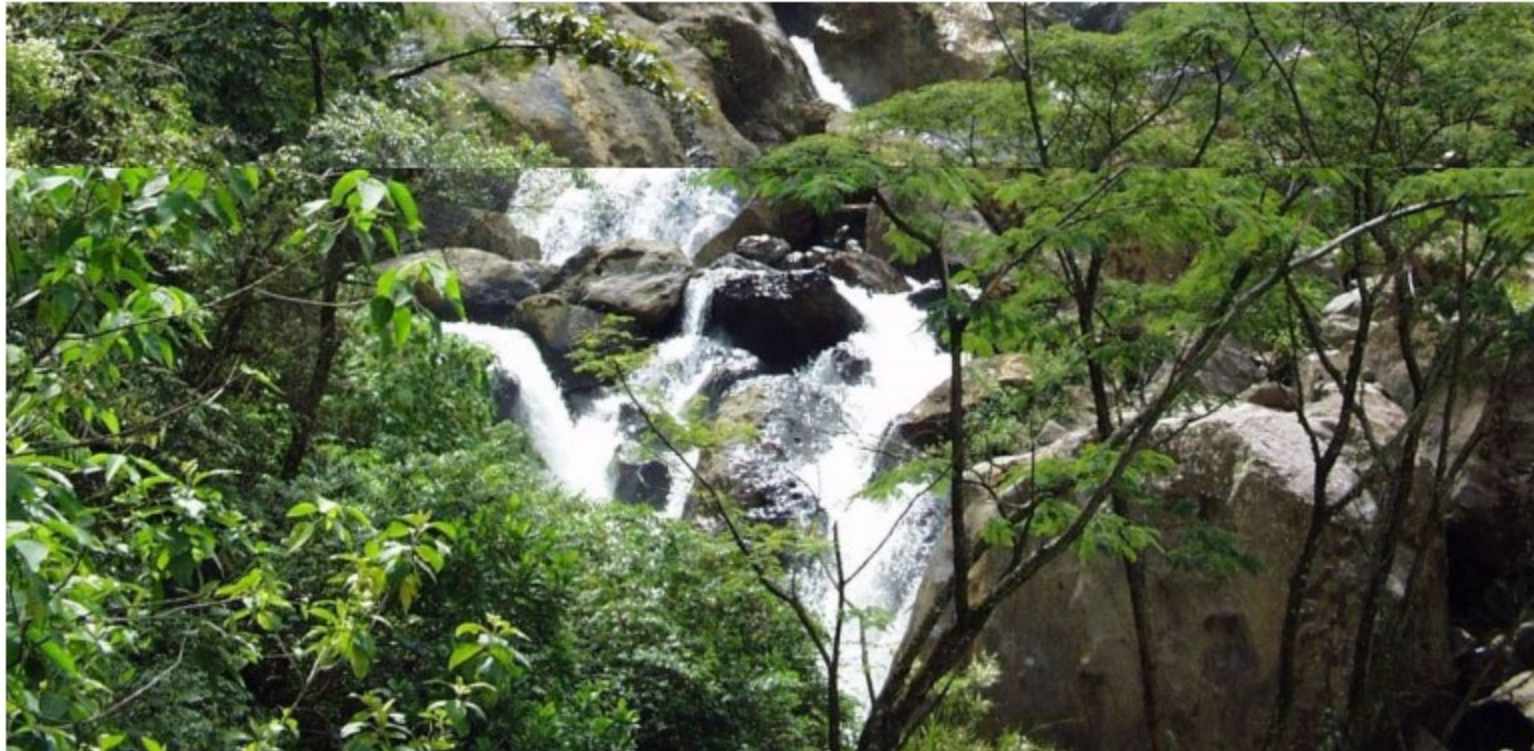
Bosques colombianos.

La estrategia ha sido liderada por Ecopetrol , Wildlife Conservation Society y el Instituto Humboldt.