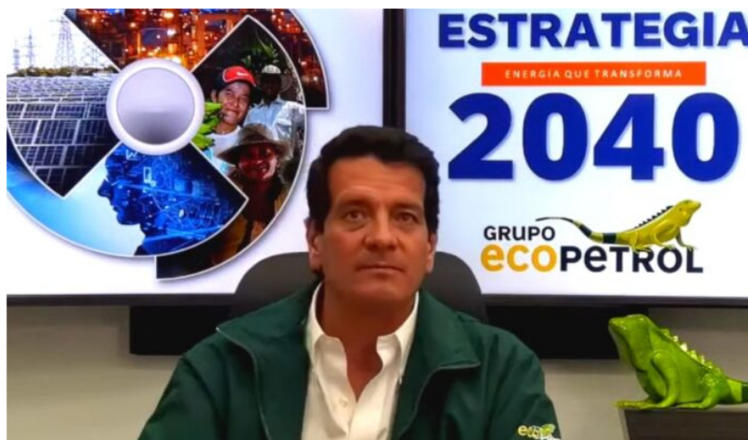
Felipe Bayón, cuestionado por sus comunicados desafortunados.

El presidente de Ecopetrol Felipe Bayón es cuestionado por los inversionistas minoritarios por su mal gobierno corporativo, sobre todo porque publica comunicados en contra de los inversionistas.