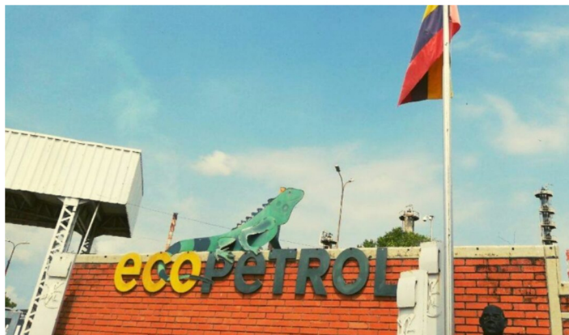
Ecopetrol emitiría nuevas acciones para pagar la compra de ISA.

El petróleo brent cerró esta semana en $95.05 (muy probable toque los $100 USD), mientras que la acción de Ecopetrol sigue rezagada. Los buenos resultados de la compañía mayoritariamente estatal no se ven reflejados en la cotización. (Relacionado: El presidente de Ecopetrol Felipe Bayón ayuda a la especulación en los inversionistas)