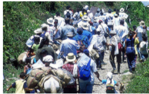
NACIONAL / Desplazamiento de familias en Guapí por amenazas de grupos armados

COLUMNISTAS, OPINIÓN / Colombia, lejos de una Fórmula 1