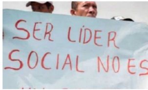
NACIONAL / Activan ruta de protección a líderes amenazados en Barrancabermeja