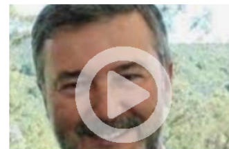
RD A QUITAR TIERRAS DE CAMPESINOS EN

MINUTO A MINUTO / De Harvard a quitar tierras de campesinos en Urabá | HSB Noticias