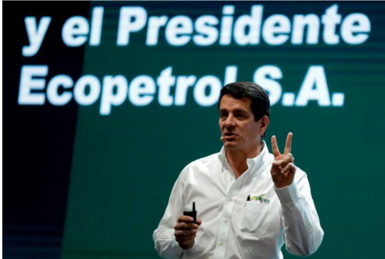
La Empresa reitera que el diálogo constructivo es el único camino que conduce hacia la generación de una convivencia en armonía.

Ecopetrol también rechaza hostilidad y agresiones físicas y verbales en Cantagallo (Bolívar), se suma al nuevo sabotaje a la infraestructura petrolera en Puerto Wilches (Santander).