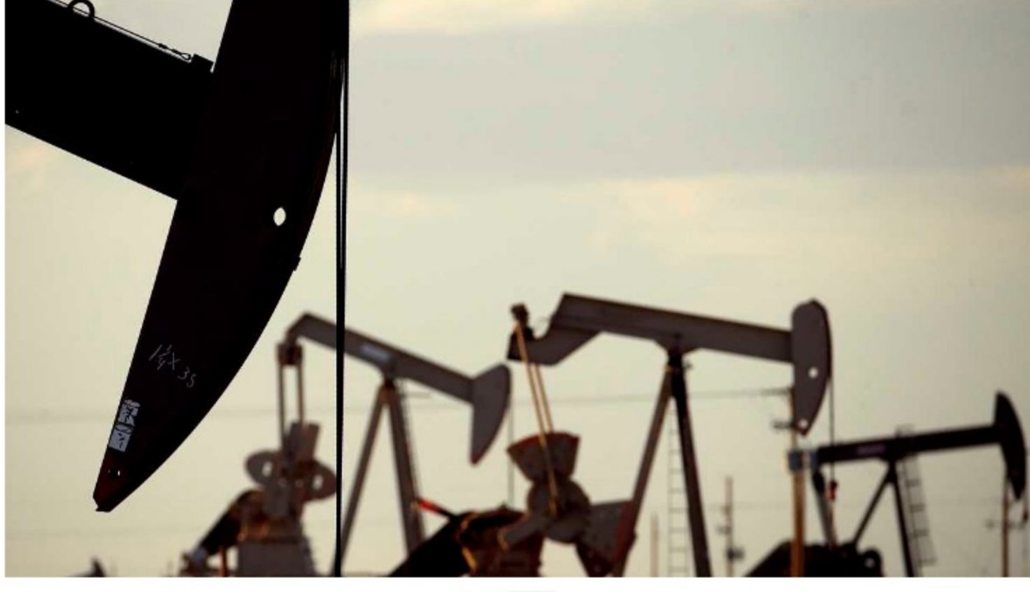
Extracción de petróleo

Es un hecho que Colombia no es un país petrolero. De hecho, en 2021 la producción de crudo tuvo una caída que no se veía desde 2016. El año pasado salían del subsuelo 736.356 barriles por día, consolidando una disminución de 5,7% frente a 2020.