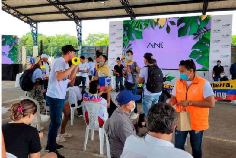
Jóvenes y organizaciones sociales se presentaron en la reunión informativa del proyecto piloto Kalé, en Puerto Wilches, para liderar un plantón en rechazo a los yacimientos no convencionales.

Ecopetrol afirmó que agresiones al personal de logística, sabotaje a los equipos tecnológicos e ingreso a la fuerza. Líderes juveniles y ambientales dicen que se trató de una protesta pacífica.