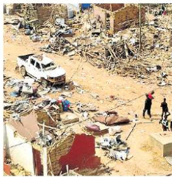
Restos de la explosión del camión de Maxam que se dirigía a una mina de oro al oeste en Ghana.

El camión, propiedad de la empresa Maxam , transportaba explosivos a la mina de oro de Chirano, gestionada por Kinross Gold Corporation , con sede en Toronto, cuando chocó con una motocicleta, se incendió y explotó, arrasando un pueblo junto a la carretera e hiriendo al menos a 100 personas.