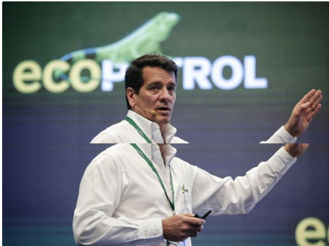
Felipe Bayón, presidente de Ecopetrol.