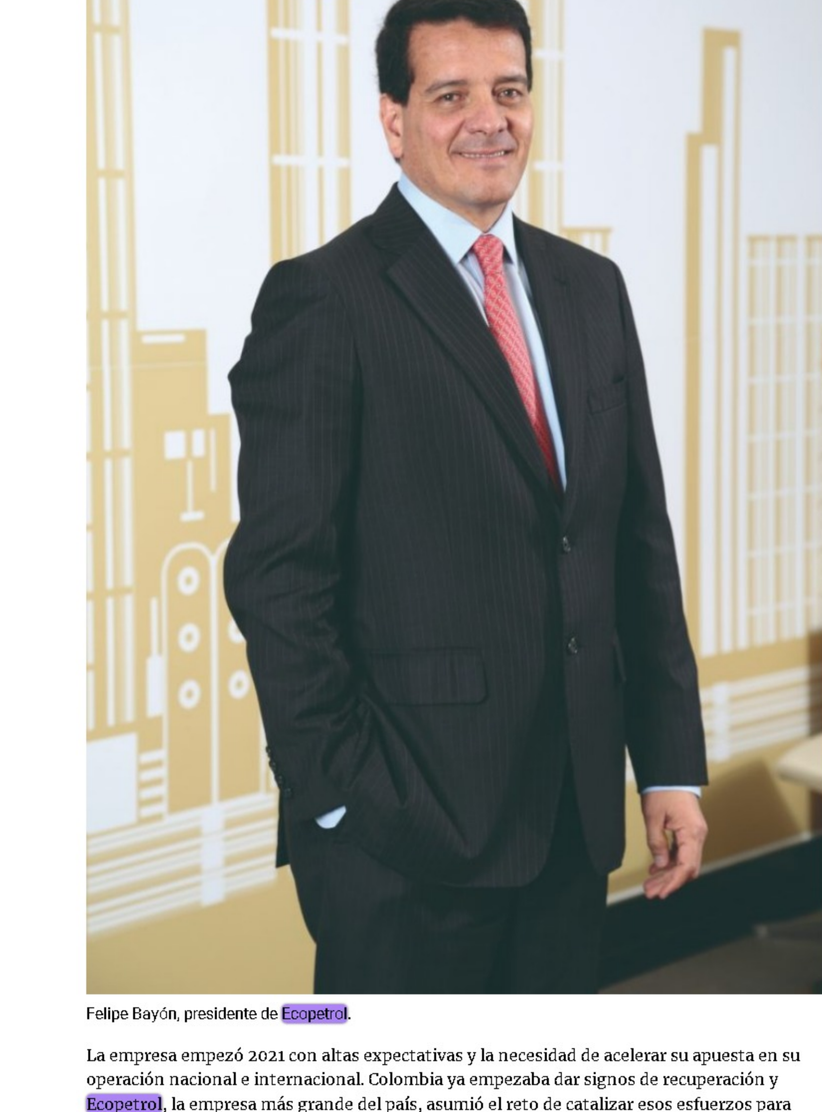
Felipe Bayón, presidente de Ecopetrol .

“Fue un año retador para la industria debido al desplome en los precios de petróleo por cuenta de la sobreoferta provocada por los desacuerdos al interior de la OPEP+ y posteriormente, por los desafíos asociados a la pandemia del covid-19”, dijo en su momento Bayón. “ Ecopetrol logró afrontar este reto sin precedentes, demostrando su resiliencia y capacidad para adaptarse a un ambiente adverso y volátil”.