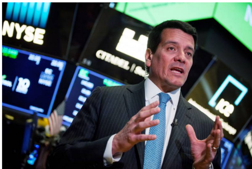
Felipe Bayón, presidente de Ecopetrol .

El plan estima niveles de producción entre 700 mil y 705 mil barriles de petróleo equivalente por día en el 2022, llegando a niveles cercanos a 730 mil en el 2024