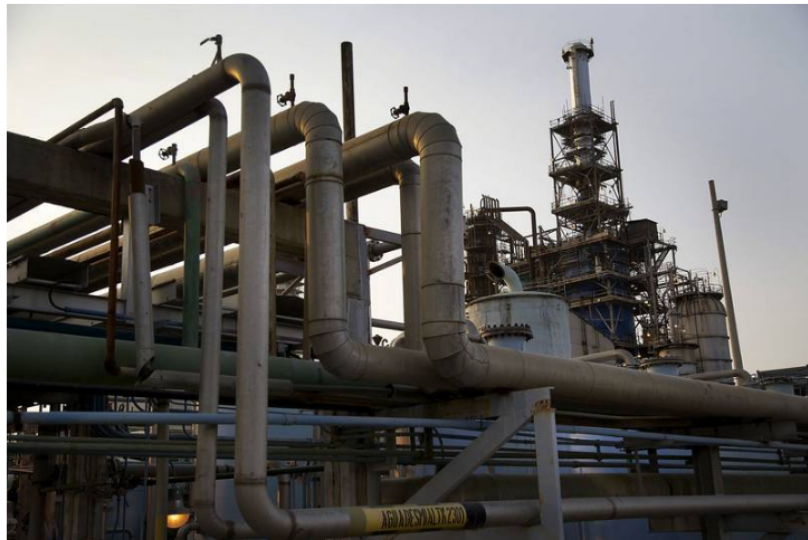
Ecopetrol La refinera de petróleo Ecopetrol SA se encuentra en Cartagena, Colombia, el martes 13 de marzo de 2012.