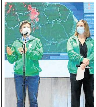
Secretaría de Ambiente