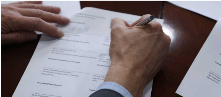
Colombia firma memorando con Países Bajos para la creación de un corredor de exportación e importación de hidrógeno

Este lunes, el Gobierno Nacional firmó un memorando con Países Bajos, con el cual Colombia podrá aligerar la capacidad de producir hidrógeno bajo en carbono.