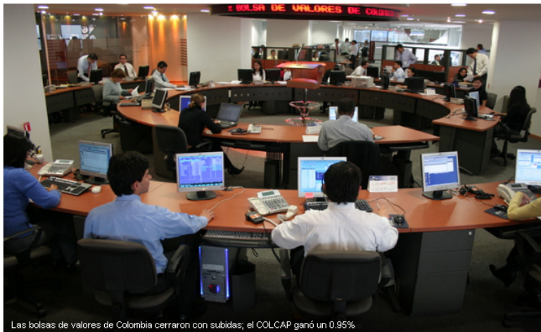
Las bolsas de valores de Colombia cerraron con subidas; el COLCAP ganó un 0.95%

Investing.com – El mercado de Colombia cerró con avances este lunes; las revalorizaciones de los sectores industria , agricultura , y servicios empujaron a los índices en alza.