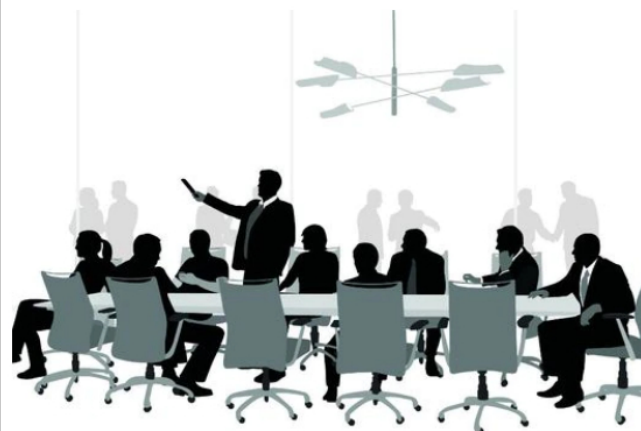
Tanto la junta directiva de Sura como la de Nutresa tiene siete miembros.