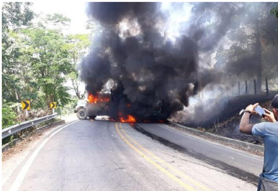
Vehículos incinerado en el municipio de Tibú